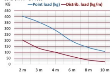
LOAD CHART - EN-1090